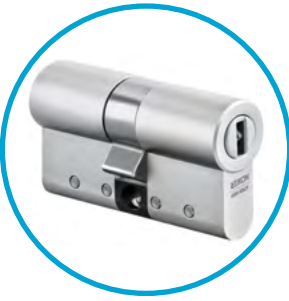
Die Eingangstür sichern Sie mit einem Doppelzylinder.