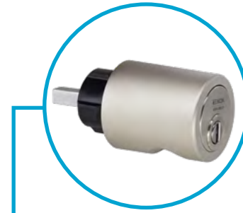
Schränktüren sichern Sie mit einer Möbelolive.