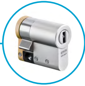
Ihre Alarmanlage sichern Sie mit einem Halbzylinder.

Hoher Datenschutz durch „end to end“-Verschlüsselung vom Server bis zum Schlüssel.