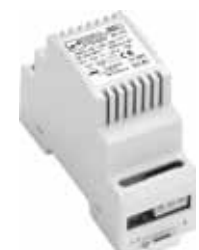
Unterputz- und Hutschiene-Netzteil